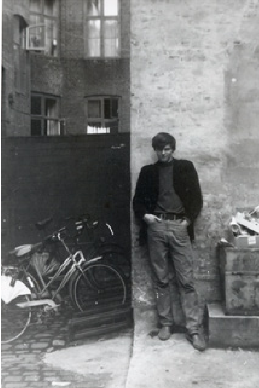
Da jeg flyttede ind i mit kollektiv i sommeren 1967, var jeg en pæn, kortklippet konservativ ung mand. Da jeg flyttede til USA i marts 1970, var jeg en langhåret, radikaliseret og vred ung mand.

dehumaniserende regeltyranni med endeløse gruppemøder for at få de samspilsramte forhold til at fungere, ja, så levede vi op til 20 mennesker sammen, nærmest i én stor stak i et og samme rum, uden at jeg eller nogen af de andre i menneskestablen overhovedet nogensinde fandt på at kalde det for et kollektiv. Fuldstændig frigjort fra regler og lange optagelsesprøver stillede jeg, eller hvem der nu tilfældigvis stod ved døren, aldrig nogen spørgsmål til dem, der bankede på og ville ind. Vi accepterede menneskene, som de var – på godt og ondt – uden at forsøge at lave dem om.