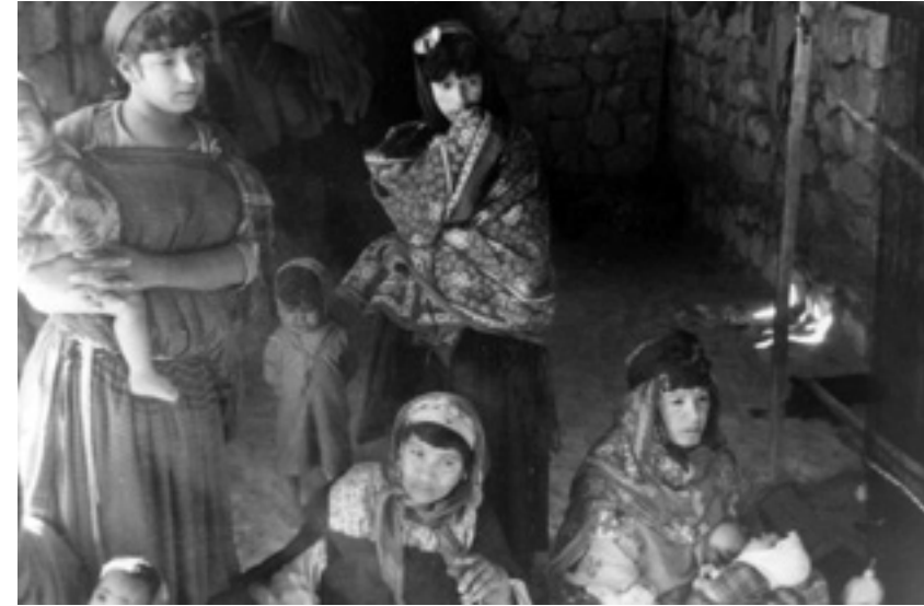
En af de utrolig gæstfrie beduinfamilier, vi boede hos i en oase på den anden side af Gafsa.