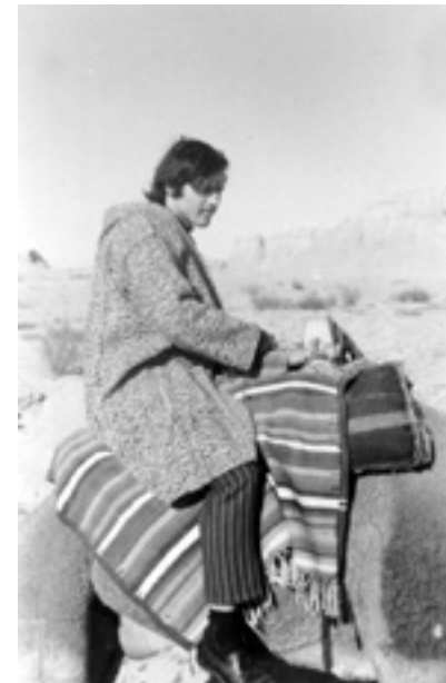
Efter Vesterbros mørke hashtåger var det en befrielsesrus at ride opløftet 500 kilometer inde i Saharas vidtstrakte og hvide ørkenlys.