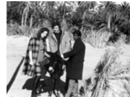
Hvem kan mon undgå – ridende på et æsel med vajende palmegrene omkring sig – at få stærke åndelige visioner?