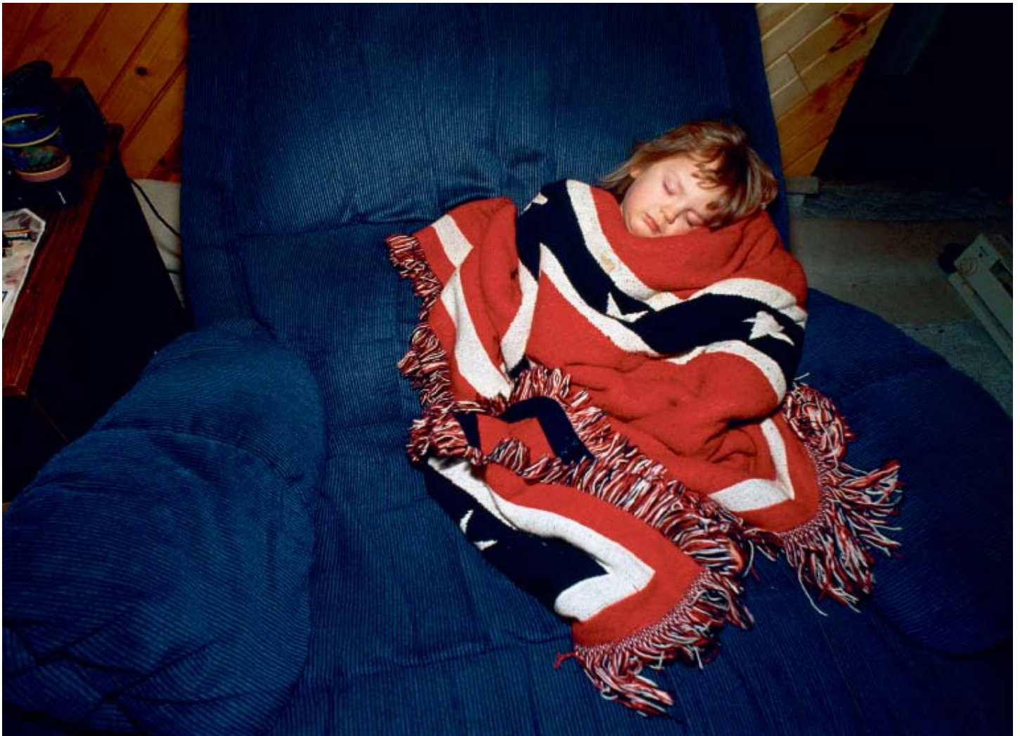
Svøbt med kærlighed i hadets tomme symbol, Butler, IN, 2002

Hvad er mere uskyldigt end et sovende barn? Hvordan virker det på os, når vi opdager, at tæppet, som skal holde barnet varmt, er et sydstatsflag? Et flag, der er blevet et vigtigt symbol på had mod de sorte, især af Ku Klux Klan.